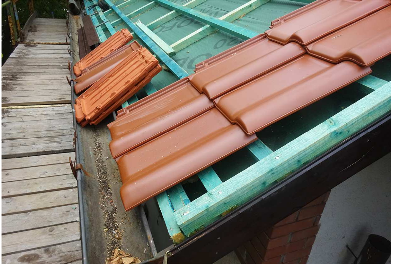
8 - 9. Új tetőfólia, cseréplécek, cserepek