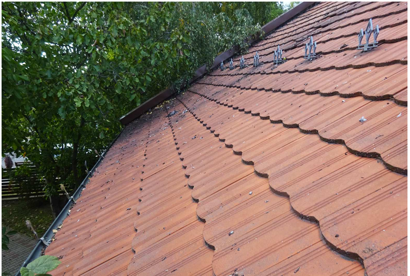
2 – 3. A tető felületek kiinduló állapotban