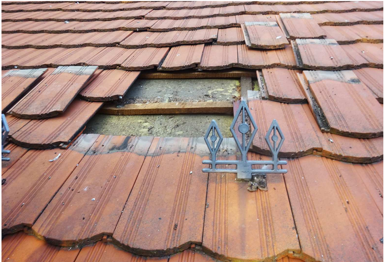
4. A cserép és a lécezés állapota