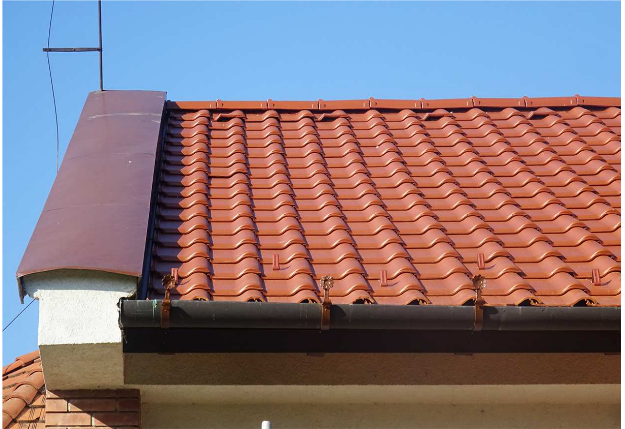
10. Az új tető mintázata