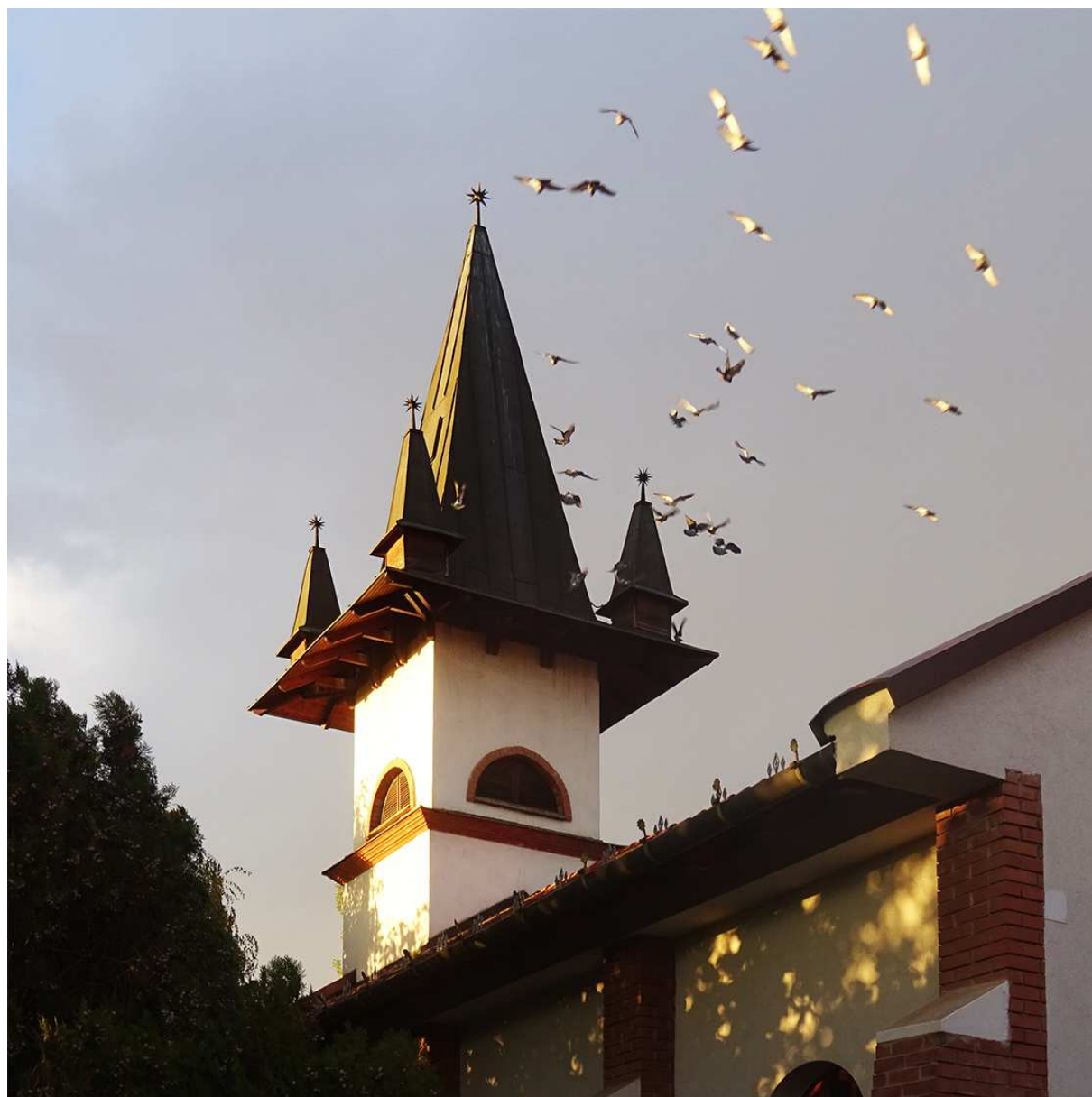
1. Kiinduló állapot – a galambok által kedvelt torony sisak