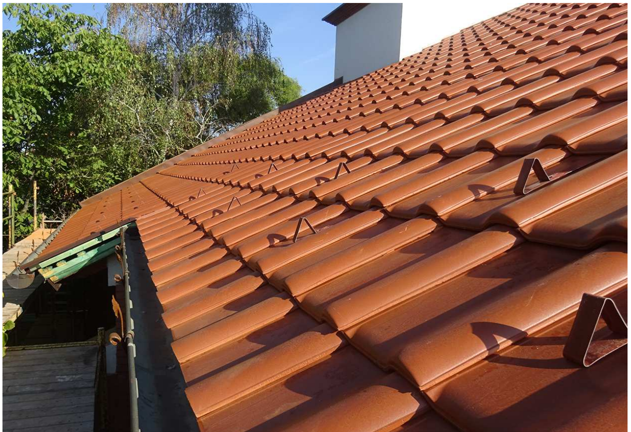
6 – 7 Megújul a templomtető felülete